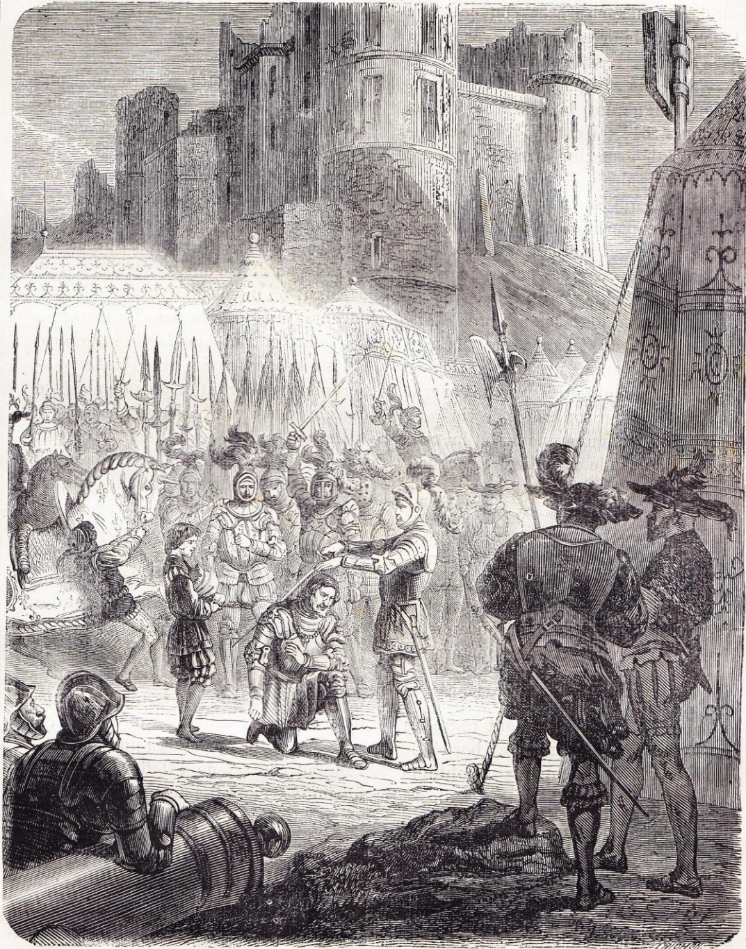
François 1 er se faisant armer chevalier après la bataille de Marignan.

paix générale, moyennant quatre cent mille écus d'or promis aux Suisses et la renonciation de Louis XII à tous ses